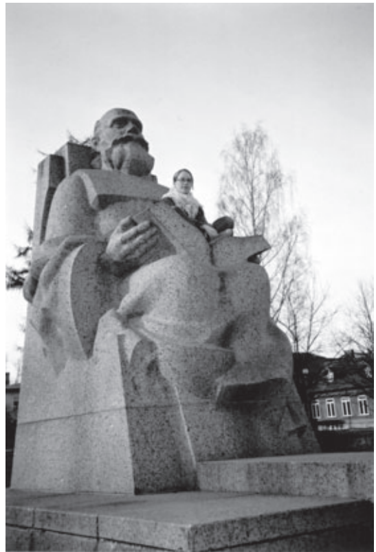
Kanna minut metsään apinamies...

tähelaev teab teed” (= tähtilaivamme tunteen) vakuuttaa teksti vastapäisen “ühikan” (ühikas=asuntola) oven yläpuolella. Kahden keittolevyn alla on jääkaappi, kylpyhuoneen lattialämmitys hyväilee aamuarkoja jalka-